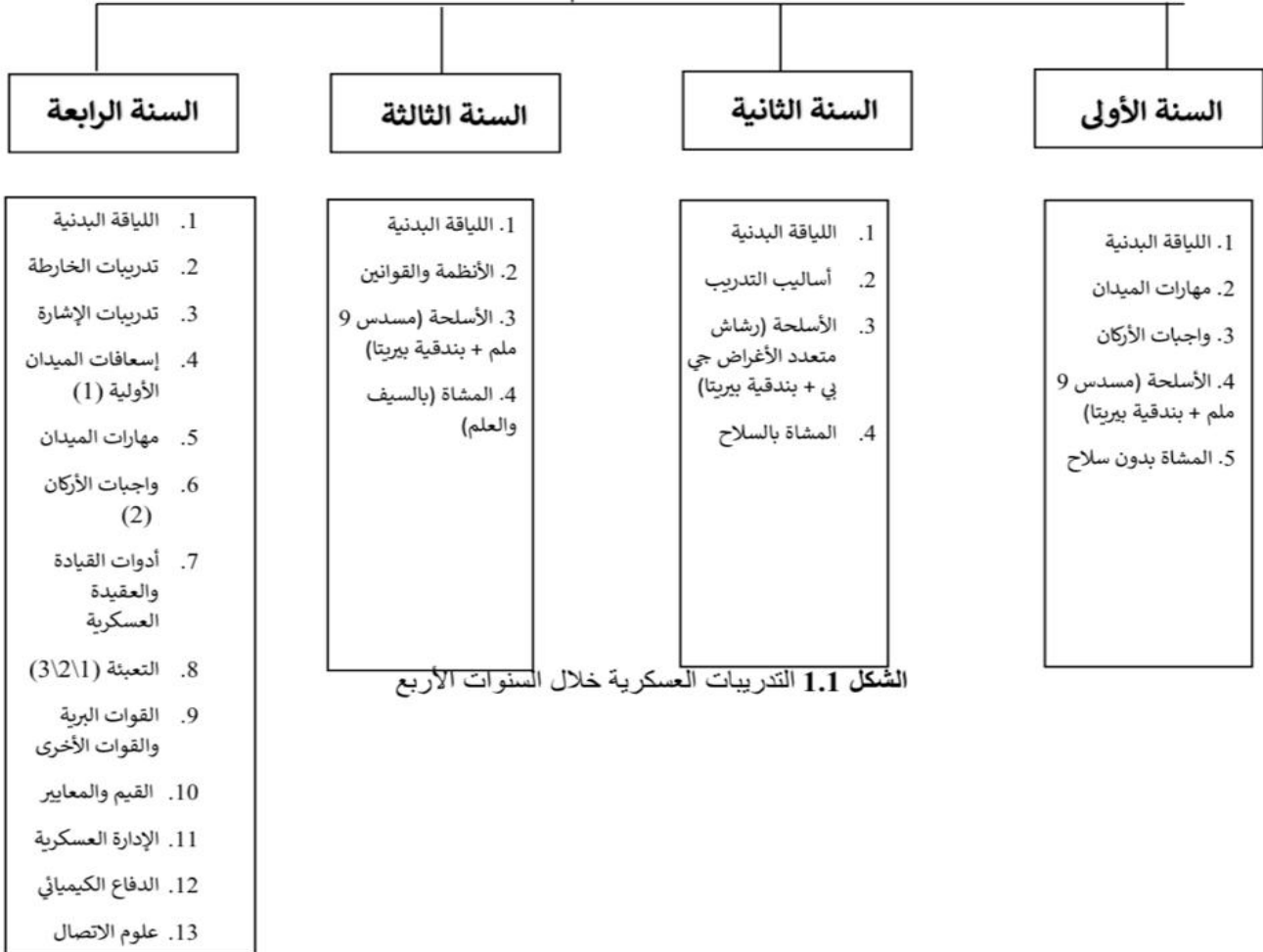
الشكل 1.1 التدريبات العسكرية خلال السنوات الأربعة