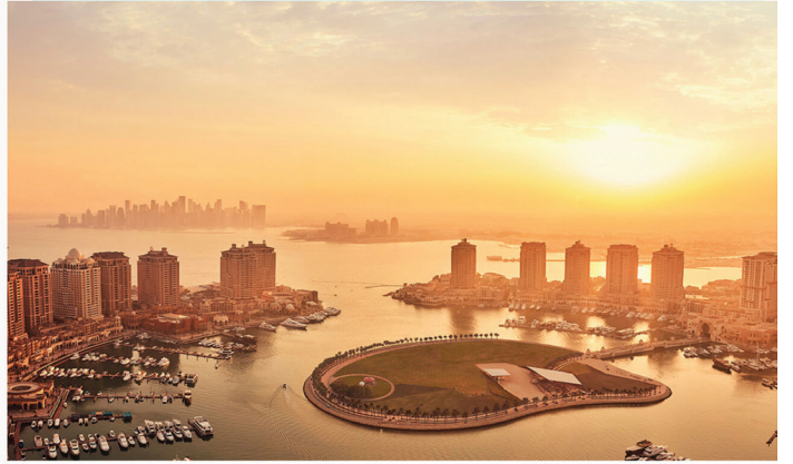
The Pearl, Qatar

تضع قطر بموقعها المميز زوارها في ملتقى ألوان الطبيعة المختلفة، وهو ما لا يتميز به إلا بعض الوجهات القليلة. ونظراً لمساحتها المتقاربة وطبيعتها الجغرافية الفريدة، فإنك ستجد الكثبان الصحراوية قريبة جداً من المياه النقية الصافية. كما تنتظرك المدن فائقة الحداثة مثل العاصمة الدوحة المحاطة بالقرى القديمة والروائع الثقافية.